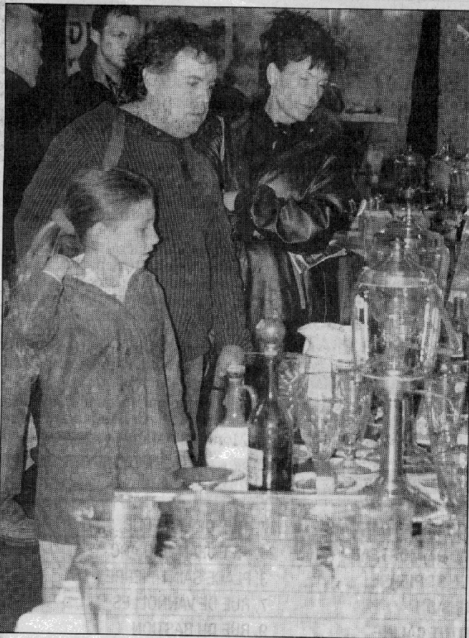
Une passion qui se partage en famille.