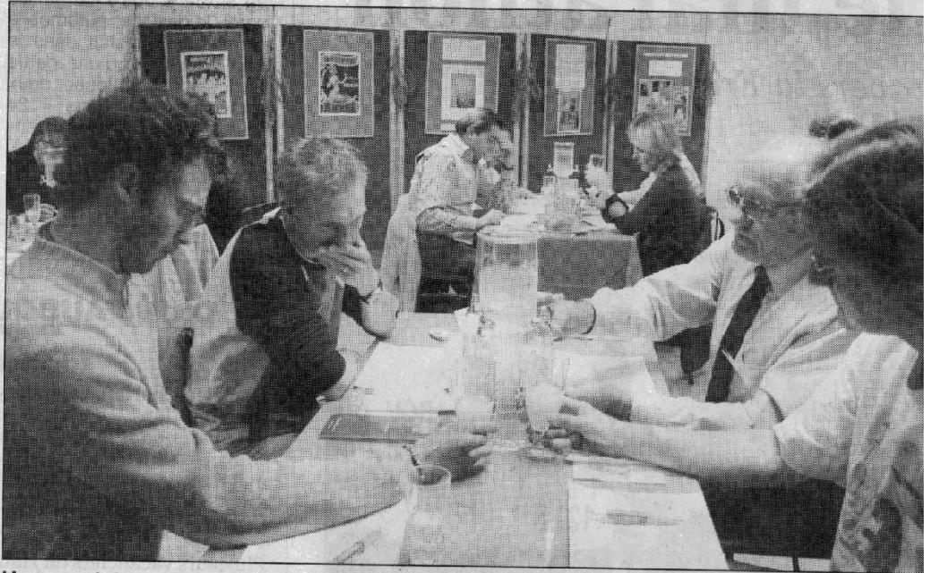
Un record de participation au concours.

Participation internationale, des Allemands avec des absinthes distillées en France mais avec leurs recettes établies en fonction des goûts de leur clientèle, des Suisses. Jury international également composé, entre autres connaisseurs, d'un biologiste slovaque, d'un internaute spécialisé suédois, d'un négociant italien et d'un cultivateur suisse.